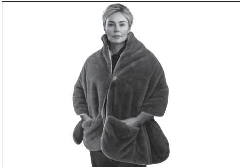
Abb. 3 - Wärmecape anlegen