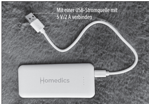
Abb. 1 - Laden der Powerbank